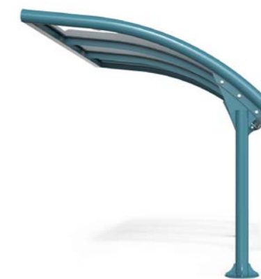
ARMONY BIKE M

Abri abri pour vélos modulaire, a face unique ou double face, en acier galvanisé et thermolaqué avec couverture de feuille d'acier ou de verre et fond en verre.