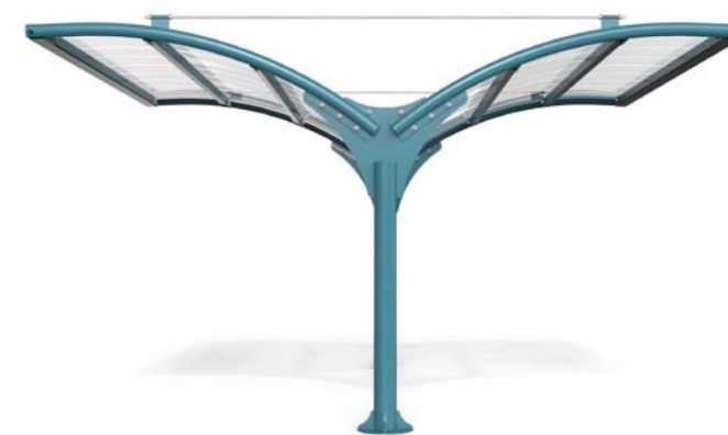
ARMONY BIKE B

Modular single or double sided bike shelter in galvanized and powder coated steel with cover in methacrylate with back glass wall.