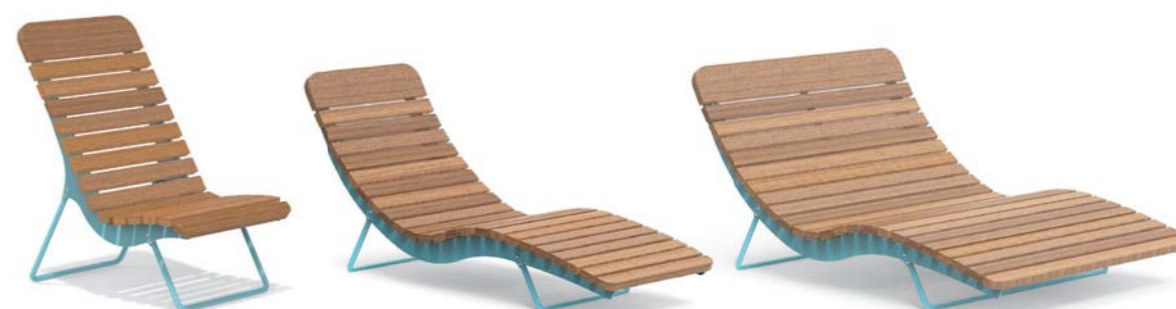
BOJON - A

Chaise longue with galvanized and powder coated steel structure, seat and backrest in exotic hardwood slats or larch wood slats, with supports in round galvanized and powder coated steel. Available in single or double version or armchair.