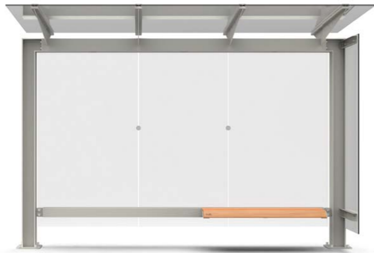
STINGRAY 1498 3M