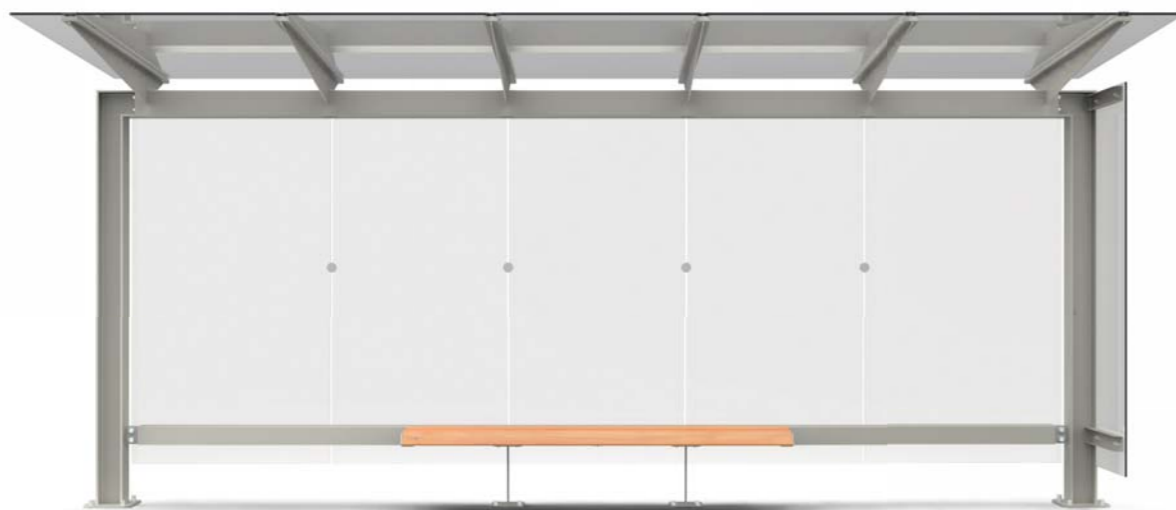
STINGRAY 1498 5M

Pensilina modulare in acciaio zincato e verniciato con copertura e parete di fondo in vetro e panca in legno. Possibilità di illuminazione a LED, pareti laterali in vetro, totem pubblicitario e bacheca a scatto A3 in alluminio.