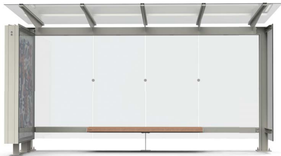
STINGRAY 1798 4M+T